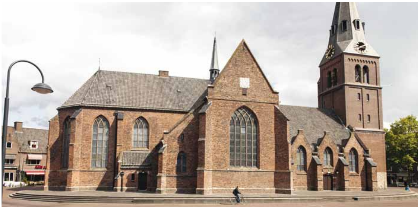
De Grote Kerk op de Markt in Wageningen.

dus ook dat we het eerlijk zeggen als wat iemand vraagt echt niet kan. Maar als je bereid bent om iemand gelijkwaardig en op een open manier te benaderen, dan heb je alles veranderd. Ik loop heel vaak met de uitvoerende professionals mee. Dan vraag ik: Wat doe je? Waar loop je tegenaan? Wat heb je nodig om het op een andere manier te doen?